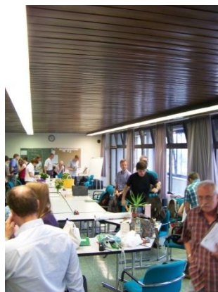
im alten Lehrerzimmer