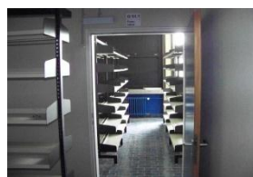
altes Fotolabor-neue Lehrmittelbücherei